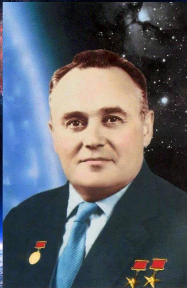
Сергей Павлович Королев