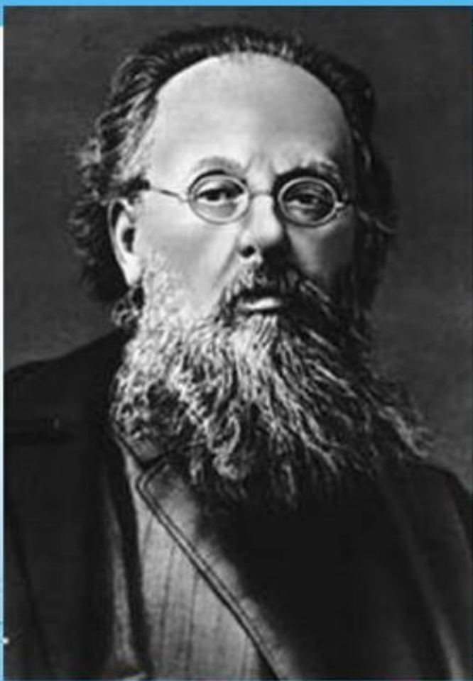
Константин Эдуардович Циолковский