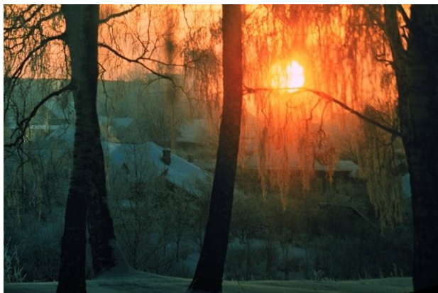
Фотоработы Бориса Викторовича Ведьмина из цикла «МОЙ ГОРОД»