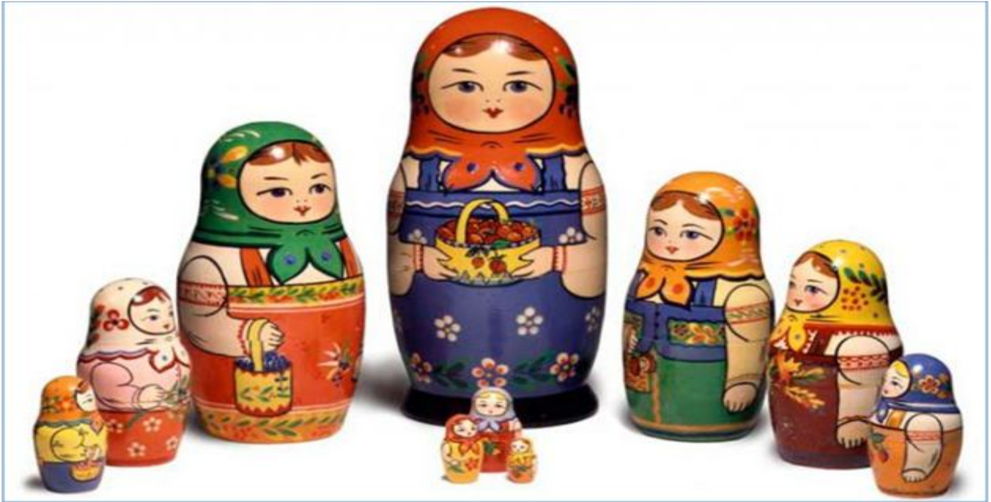
Матрешка – Русский сувенир