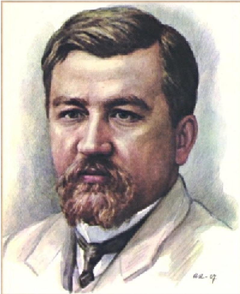
Александр Иванович Куприн